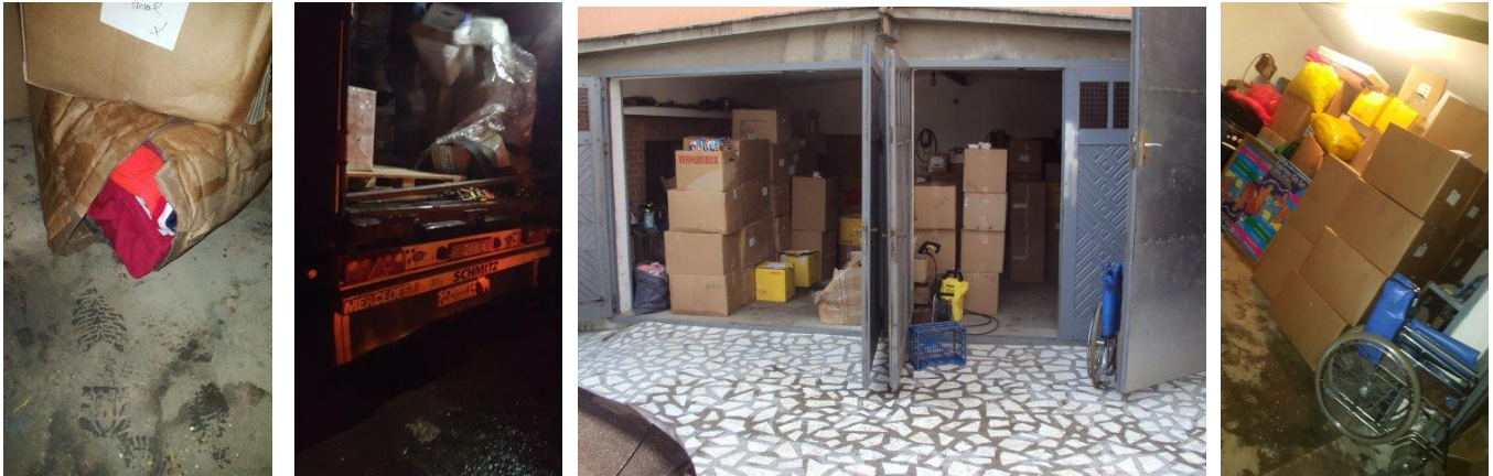
Zo kwamen de spullen aan en daarna opgeslagen in ons tijdelijke Roemeense "magazijn"

De schade aan de zending viel achteraf gelukkig mee, een paar artikelen breuk en de natte kleding kon na droging weer her verpakt worden in de meegenomen lege dozen.