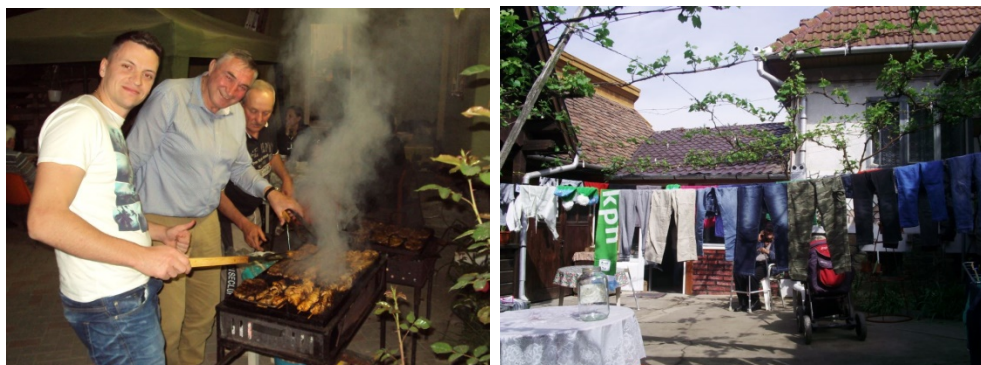
Weer een BBQ met o.a het schoolhoofd en de waslijn hangt vol met de na geworden kleding.