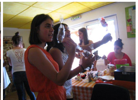
De kinderen zijn razend enthousiast over de keukenspullen namn Jamie Oliver, horloges en chocolade en snoep. Een luxe voor ze