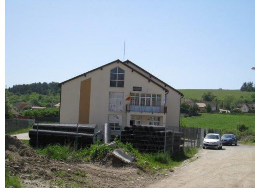
Snoepgoed en spinners voor de kinderen en de tijdelijke school aan de overkant. Vrijwel nieuw, verbazingwekkend dat ze er niet mogen blijven.