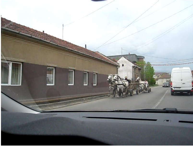
Ze rijden er nog steeds!!!! Een luxe 2 PK gevolgd in de slipstream door een 1 PK