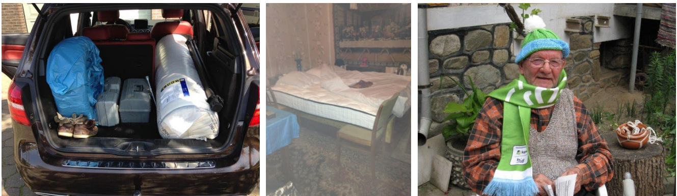
Het rolletje met de verwachte top dek bleek dus een monsterlijk groot matras!

Na de gebruikelijke BBQ werden de persoonlijke pakketten met enthousiasme bekeken en in ontvangst genomen. Voor de zoon alvast voor het geval hij op zichzelf gaat wonen.