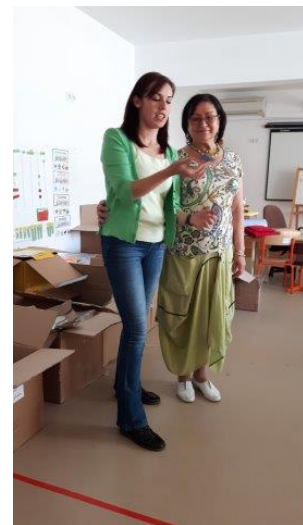
Zij wilde weten of haar mond leek op die van de aap! ( wij zeiden niks!) Met de directrice de inhoud van de dozen inspecteren en de spinner demonstreren.

Bij ons tweede bezoek aan Rusciori, het zigeunerndorpje met de gesloten school bleken de kinderen gewoon bij het afgekeurde gebouw te spelen en werd hun eten in hetzelfde gebouw klaar gemaakt!?!?. Zij stelden wel nog prijs op wat eventueel beschikbaar was aan kleding etc. dus dat konden we regelen. Wij bezochten de nieuwe locatie ( tegenover de gesloten school) waar de kinderen tijdelijk mogen verblijven en natuurlijk moesten we weer mee eten en hebben snoep, chocolade en spinners daar uitgedeeld en een paar dozen met kleding, schoenen, speelgoed en keukengerei.