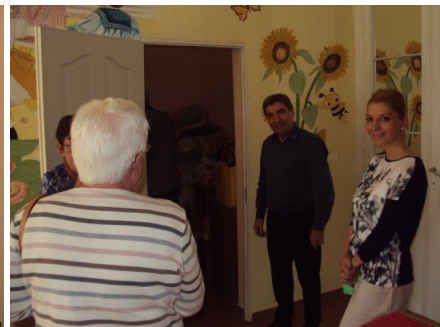
Volle karren met het meest noodzakelijke voor de kinderen, de tandenborstels en pasta en de assistente volop met de vertaling bezig.