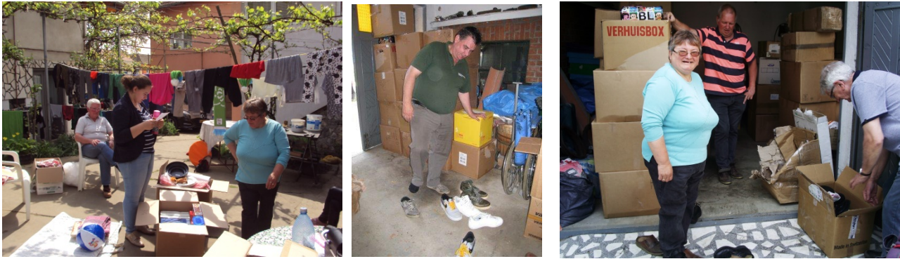
De nat geworden kleding hangt te drogen en de privé pakketten worden ook hier aandachtig bekeken en zo goed als nieuwe schoenen gepast.